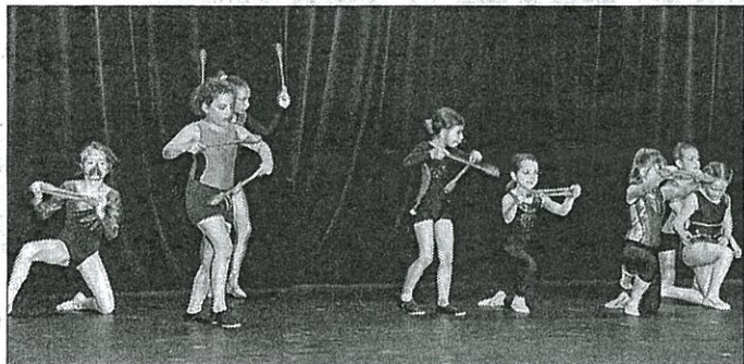
■ Des exécutions bien maîtrisées.

L'activité gymnastique rythmique et sportive, et zumba kids, de TSL (Tomblaine Sports loisirs) est désormais placée sous la bannière de l'association "Gardons la Forme" qui a conservé le principe du traditionnel gala de fin d'année proposé aux parents, grands-parents et amis. Sur le plancher de l'espace Jean-Jaurès, les jeunes gymnastes